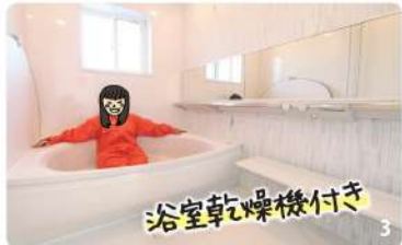
1 間口の広い洗面台は2人同時に使えるので、忙しい朝もスムーズ。 2 間仕切りを設けないことで風通しがいい書斎スペースに。 3 保温性の高い浴室は1.5坪と広々。