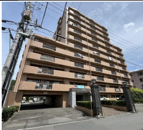
※図面と現況に相違がある場合は、現況を優先します。

WICを居室としても使用できます！現在空室のため、比較的好都合の良い日時でご内覧可能です！松山市中心部まで車で約10～15分、道後小学校まで徒歩約3分、道後中学校まで徒歩約5分！有名観光地「道後温泉」も徒歩圏内でコンビニをはじめ、ドラッグストア、スーパー、バス停も点在しており、利便性の高い立地ですが、閑静な住宅地に佇んでおります。ぜひ一度、現地や周辺環境も含め、ご覧くださいませ♪