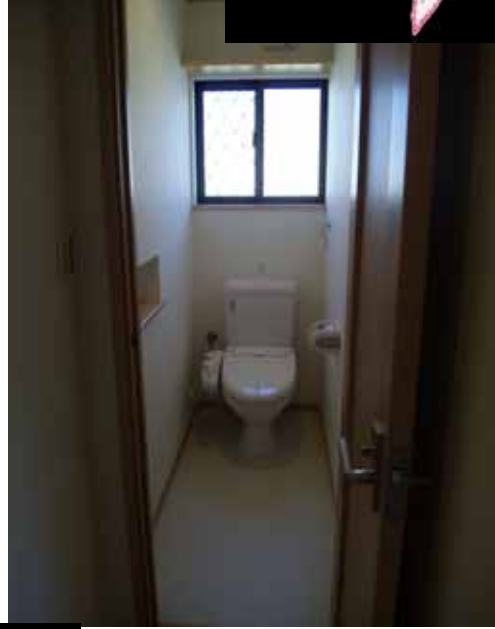
1 豊トイレは広いです。 (ヒロシ)