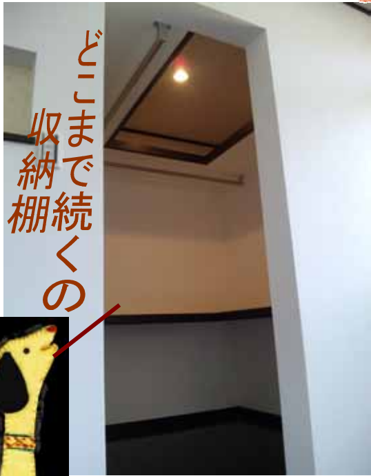
どこまで収納棚続くの