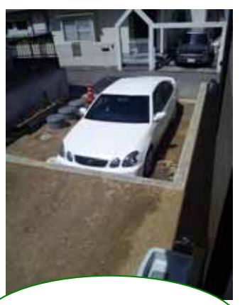
愛車も上から眺めるぜよ。