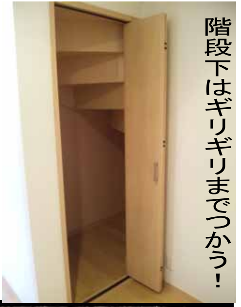
階段下はギリギリまでつかう！