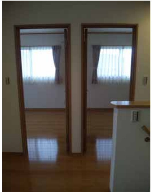
将来は仲良く 5.5 畳にします