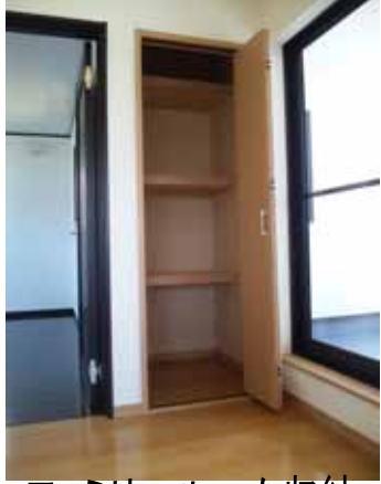
ファミリールーム収納