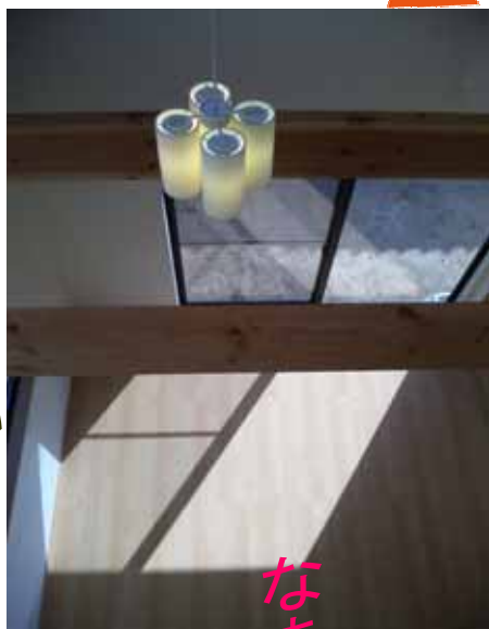
おすい と呼ばば、下から