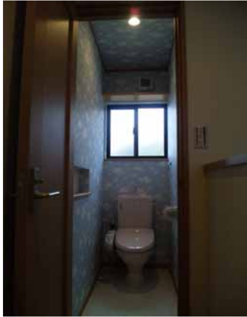
SKYトイレはこれだっ！