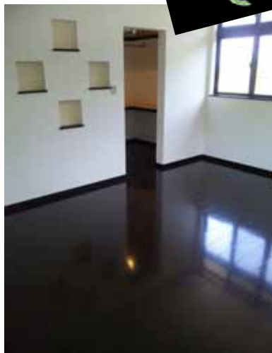
ヴェンゲブラックと 四つ葉のニッチ