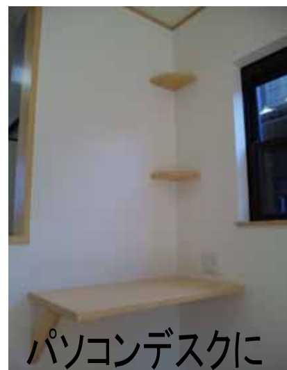
パソコンデスクに 扇形棚