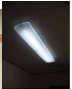
キッチン全体を照らす ワイド照明