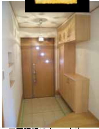
王冠照明はオーラを放つ