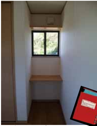
勉強デスクは お手のものッ