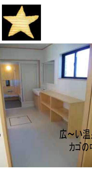
広〜い温泉気分の洗面所 カゴの中はタオルにパジャマに〜 整理整頓