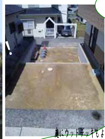
真にウッドデッキもよし それとも... もう1棟建つぜよ。