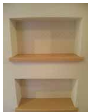
下の棚が小さく見える? 同じ大きさなのにナゼ