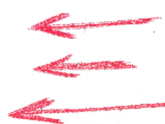
お風呂の引戸は 場所とら〜ず