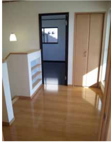
ファミリールームは 3畳でOK