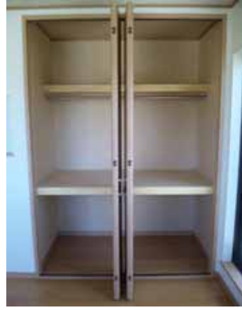
わあ 動いてる！ クローゼット