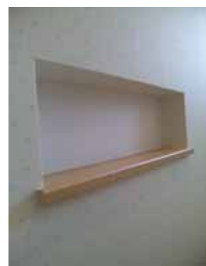
長方形なのに台形に見える (錯覚)