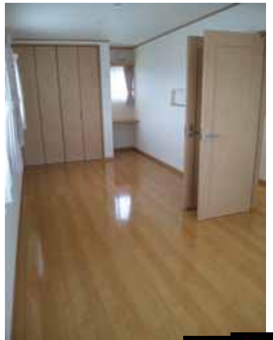
広〜い 11 畳