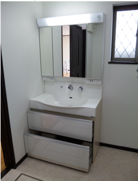
引戸Open は、使いやすい!!