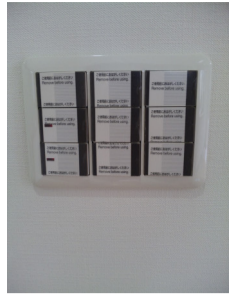
16の電気ルート 覚えるのに何年かかる?