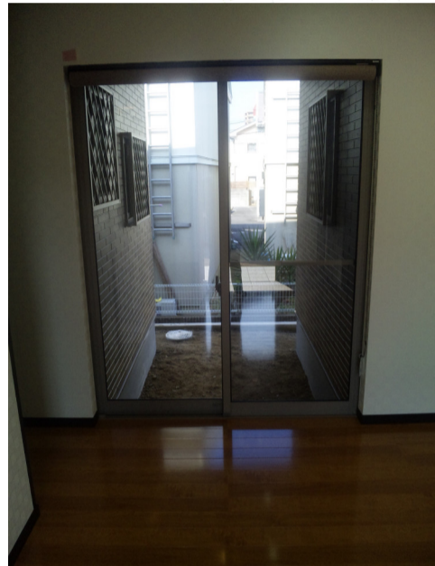
玄関から中庭へ また3帖あるのー