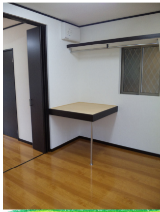
帽子, ジャケット, パンツ ワンピース, ドレス, 座布団