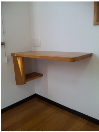
電話帳対応カウンター