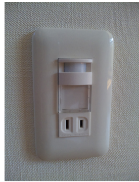
フツと 気が利く 足元灯 ♡