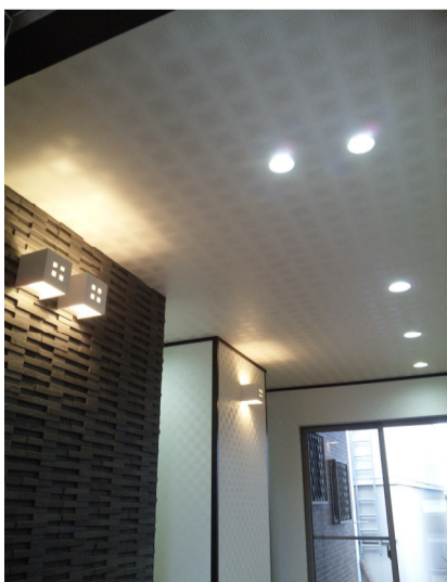
石壁とホワイト壁は 黒ブチ★