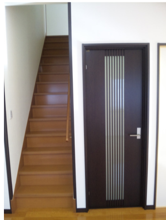
入口から階段と コンパクトに...