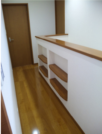
2F family廊下は 本棚に変身