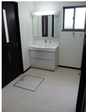
洗面所は 4帖取る時代