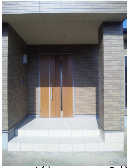
どわっ。。。3帖 玄関ポーチ柱