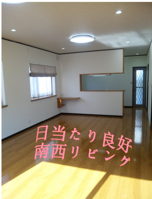
日当たり良好 南西リビング