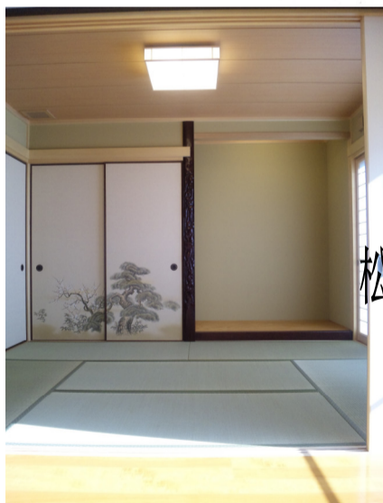
松フスマに床柱付きの和室 落ち着くわあ〜❤️