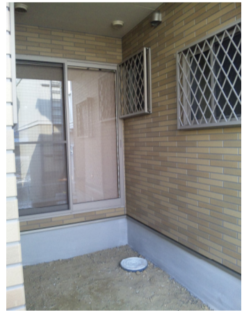
裏庭からの 中庭はこんな感じー