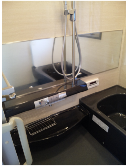
ワイドガラスは 大きく見せる役目も!!