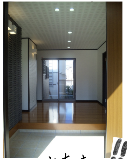
出たあ!! ↑↑ 7.5帖玄関