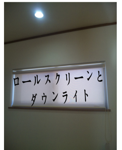
ロールスクリーンと ダウンライト