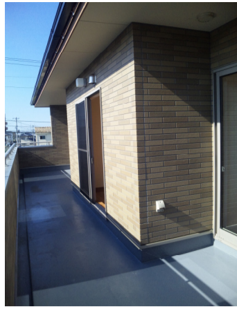
西) しい〜三兄妹テラス付ベランダ。。。