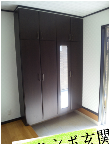
ジャンボ玄関 上から下へ見下す。❤️