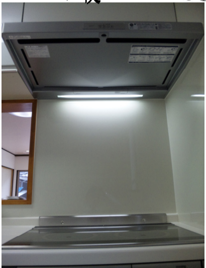
油ちりの少ない換気扇