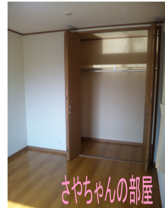
さやちゃんの部屋