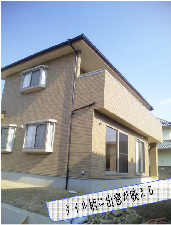
タイル柄に出窓が映える