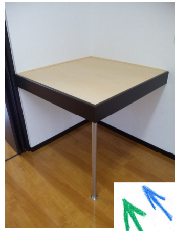
1本足棚とはコレです