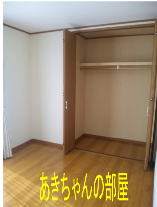
あきちゃんの部屋