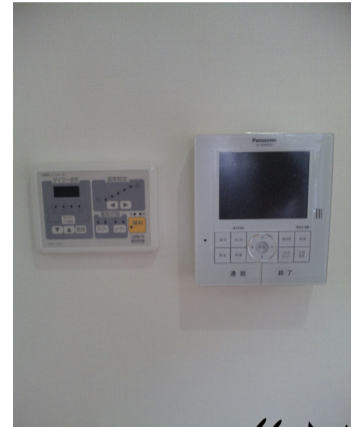
玄関TVは“目”が 動きます♪