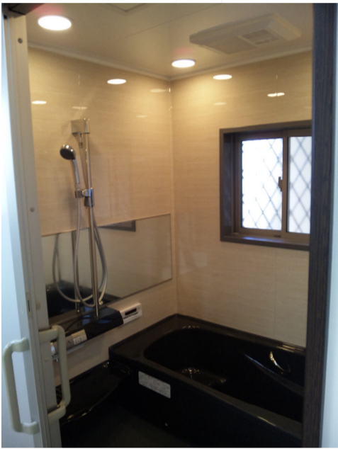
見よツ 浴室ダウンライトは 間接照明として効果的☆