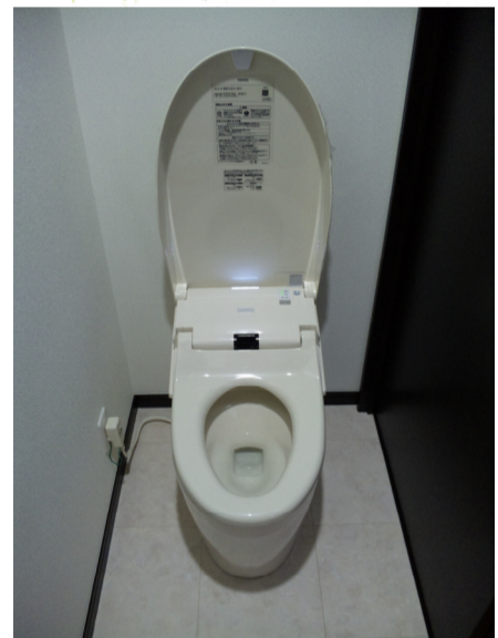
自動OPEN のトイレは節水型