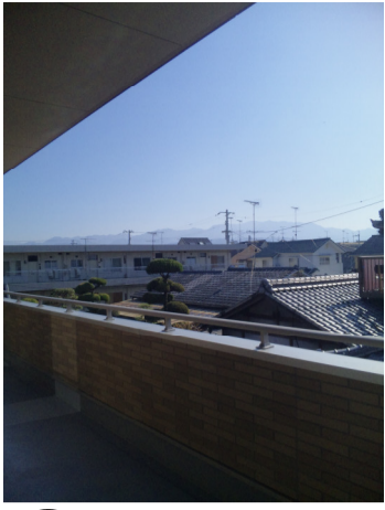
東) しい〜石籠の山あ〜 そびえ建つ建つ御殿建つ。。。