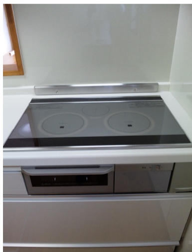
↑ ↑ ↑ 1番BIGな IHヒーター