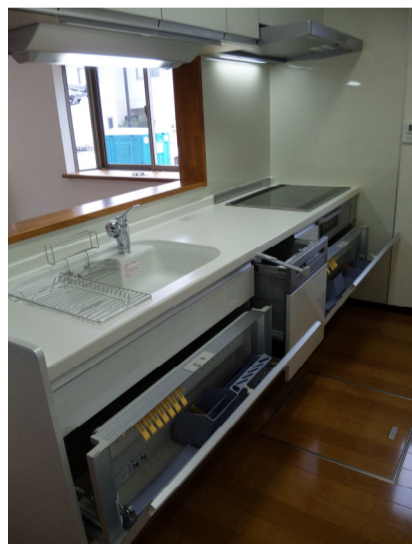
包丁入れからお玉入れまで 奥様大助かり ♡