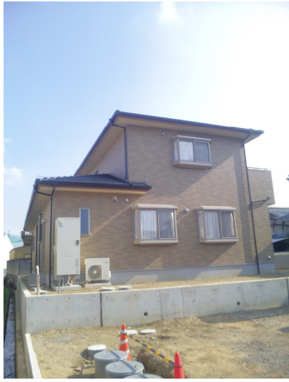
まぶしいー 鳳凰型式瓦葺