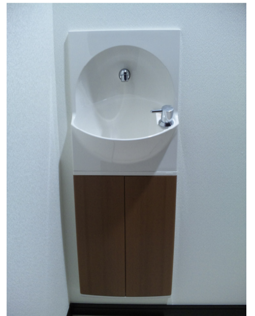
手洗いヴェンゲブラック