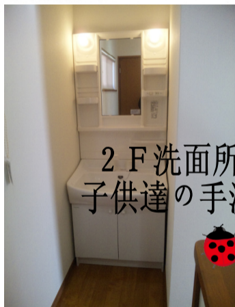
2F洗面所は 子供達の手洗場