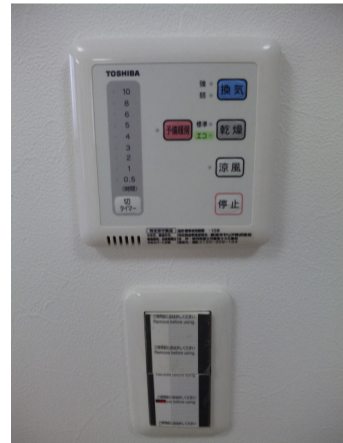
24時間システムに 浴室乾燥付き