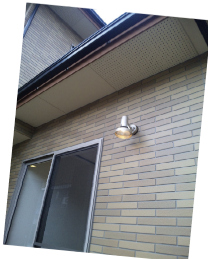
スポット照明は入切が時間orルクスでパチッ