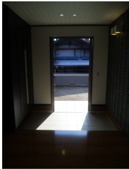
見よっ!!★★★★ 三ツ星玄関は福を入れる。