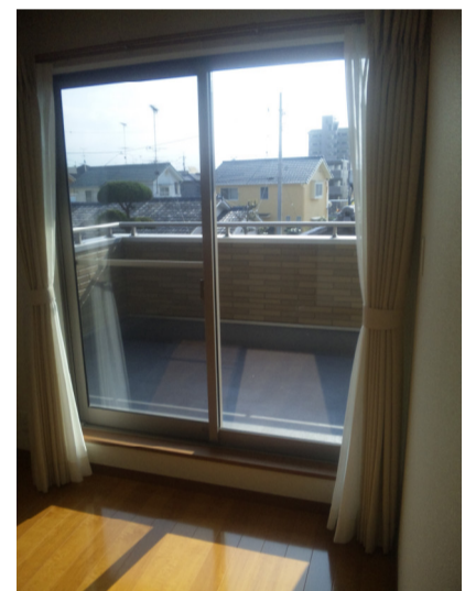
ベランダは何帖あるン?