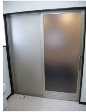
浴室の出入りは 引戸が助かる