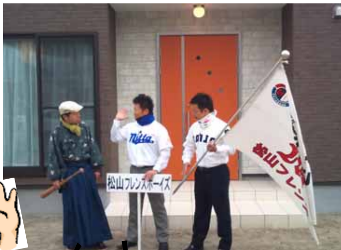
野球談義に花が咲く(岩城談)