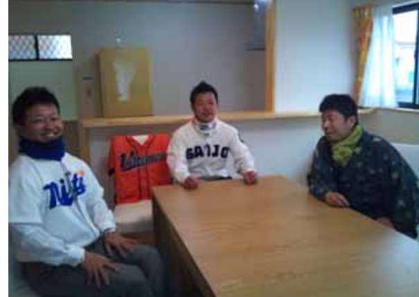
まったくアイロンがけ~