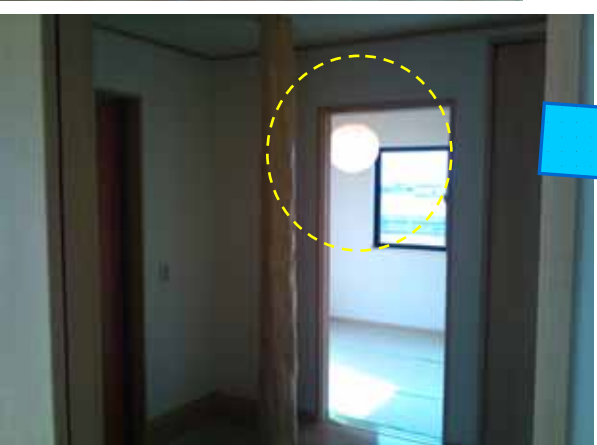
アノ丸い球体は何ダ！！