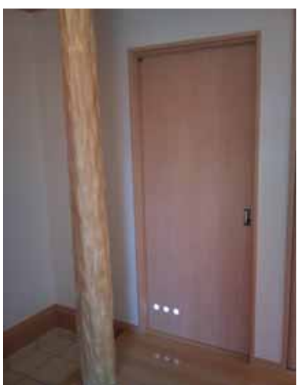
足元を灯す玄関自然照明