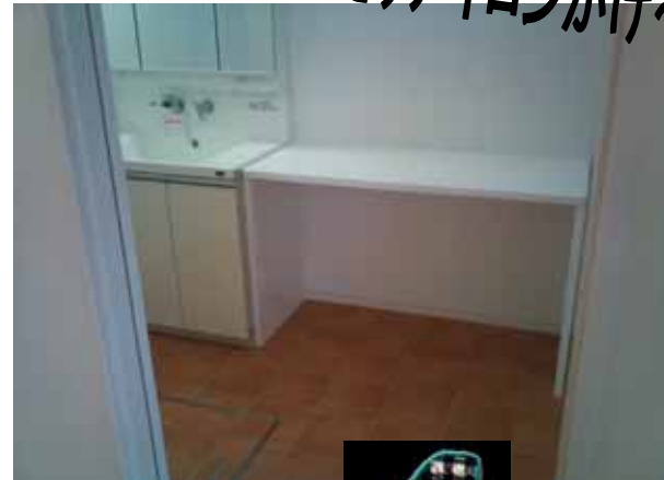
洗面室は 4 畳