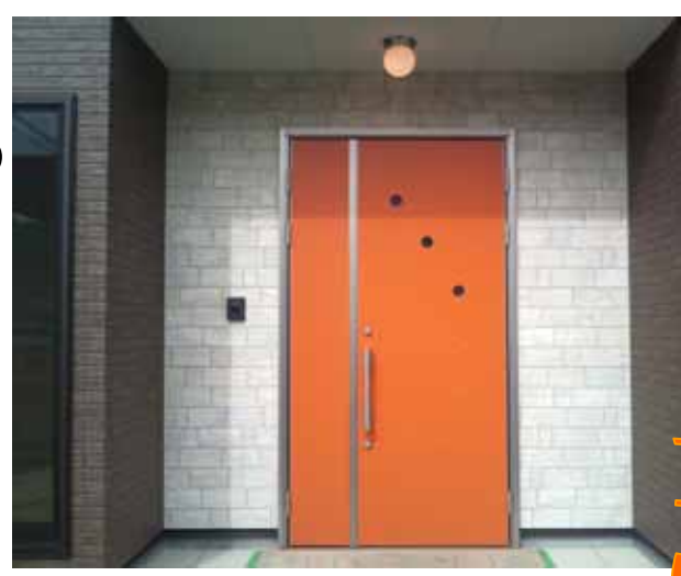
オレンジのたたずまい