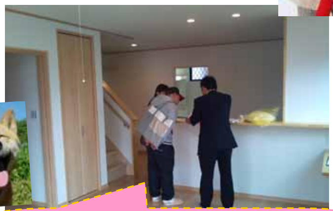
いろんな設備がありまんな～(笑談)