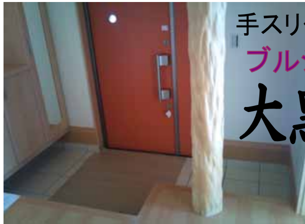
手すり代わりに ブルジョワ 大黒柱