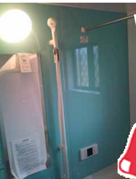
グリーンモンスター ではありません