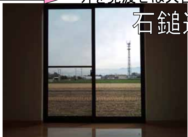
外を見渡せば大自然の