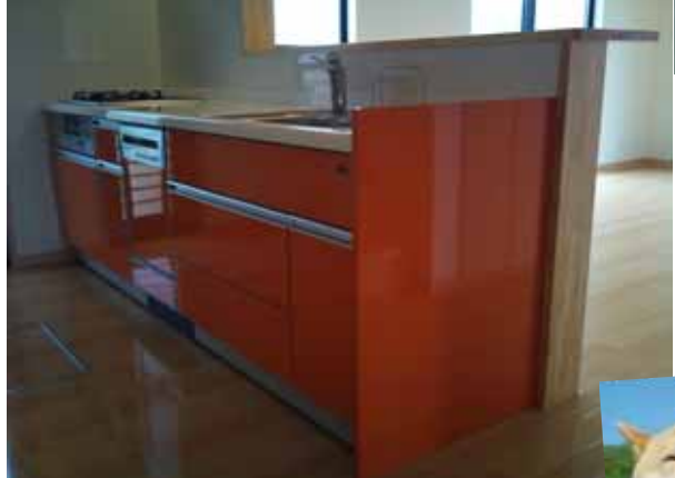
キッチンの鏡面仕上げは ピーカピカ