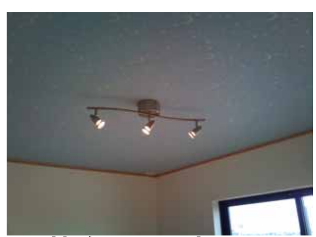
天井クロスは ヒカル君 ピカッ