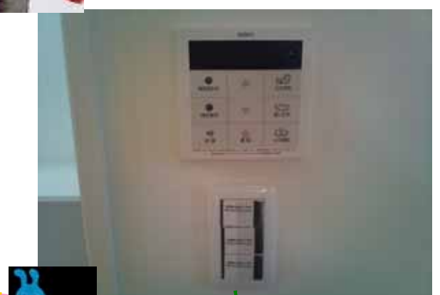
ガススイッチは壁に貼る時代