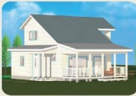
※1号地建売住宅パース