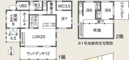
※1号地建売住宅間取